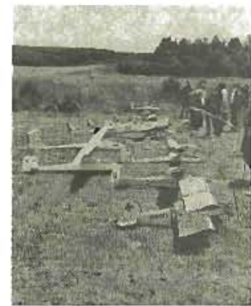
Die Modellpiloten zählen zu den Eckpfeilern des SFC und brachten i ebenfalls eine imposante Luftflot-te an den Start.