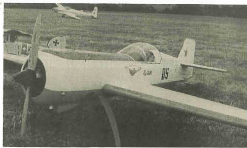
Täuschend echt, doch „nur“ ein Modell. Ein besonders prächtiges Exemplar aus der Scale-Familie.