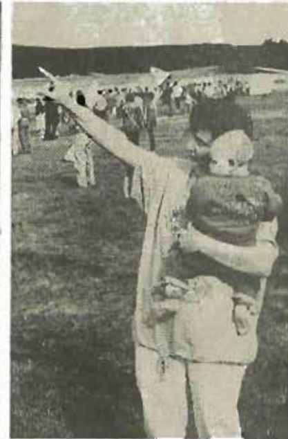
Da guck', ein Flieher! Groß und klein waren beeindruckt.

Schon am Samstag war das Fluggelände dicht „bestedtelt“. Doch die Völkerwanderung, die sich dann am Sonntag in Richtung Segelfluggelände in Bewegung setzte, übertraf die kühnsten Erwartungen der Veranstalter.