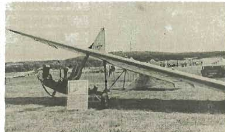
Die SG 38 kontne am Sonntag am Boden und in der Luft bestaunt werden. Auf dem Schulgleiter haben Generationen von Piloten ihre ersten Hüpfser unternommen.