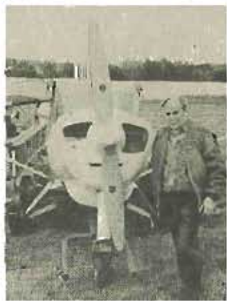
Auch der „Goggo“ aus Herborn-seelbach, ein alter Haudegen der Lüfte, inspizierte die ausgestellt-ten Flugzeuge.